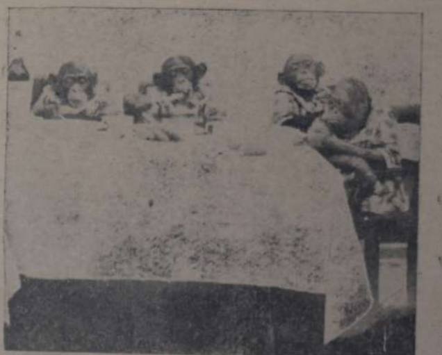
UNA FAMILIA DE PEQUEROS MONOS DOMESTICADOS POR HAGENBECK EN EL PARQUE ZOOLOGICO DE STELLINGMA