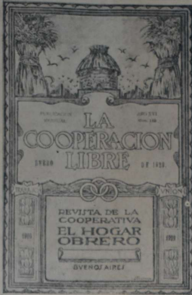
ARTISTICA CARATULA DE "LA COOPERACION LIBRE", REVISTA MENSUAL DE "EL HOGAR OBRERO"

Para ayudar una obra tan vasta y fundamental, hácese hoy mismo cooperador y presto su apoyo que será para su bien propio y para el bien de todos.