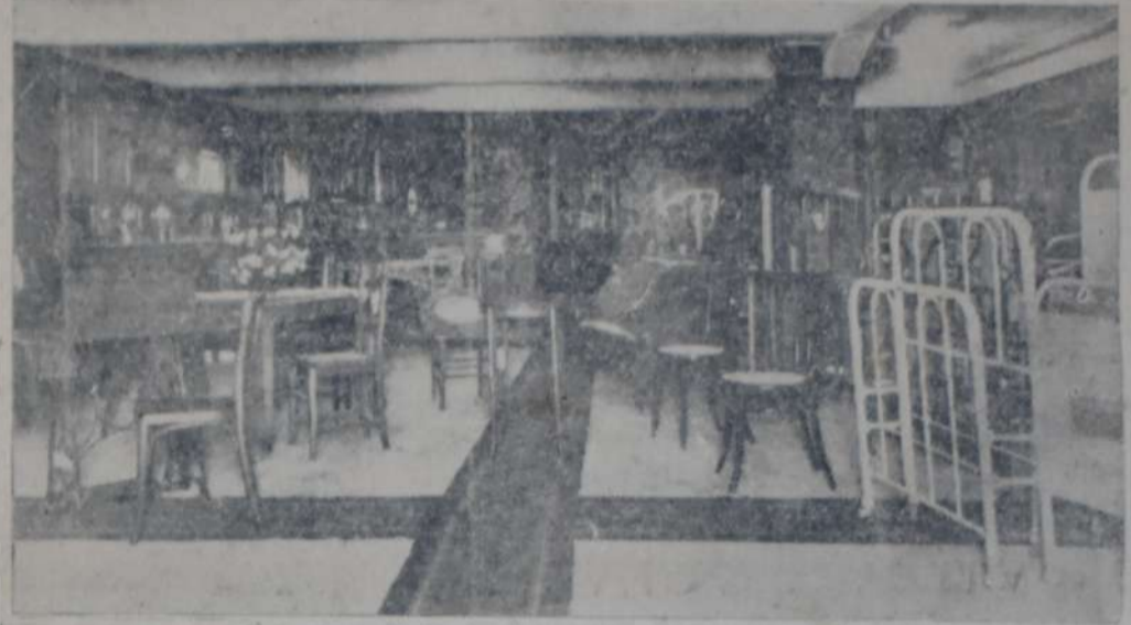
VISTA DE CONJUNTO DE LA SECCION MUEBLERIA

No nos hemos de envanecer, pero sí tenemos la grande satisfacción de que nuestra cooperativa es ejemplo, es modelo, es campo de estudio de los institutos de enseñanza técnica, y sobre sus mismas bases y orientación va multiplicándose la familia de los cooperadores de estas regiones de América.