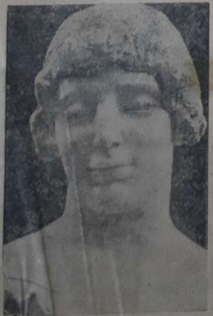
CABEZA DE MUJER