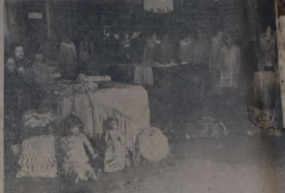
VISTA DE LA EXPOSICION DE LABORES INAUGURADA EL DOMINGO 30 EN EL LOCAL DEL CENTRO Socialista de la sección 5a, Directorio 30.