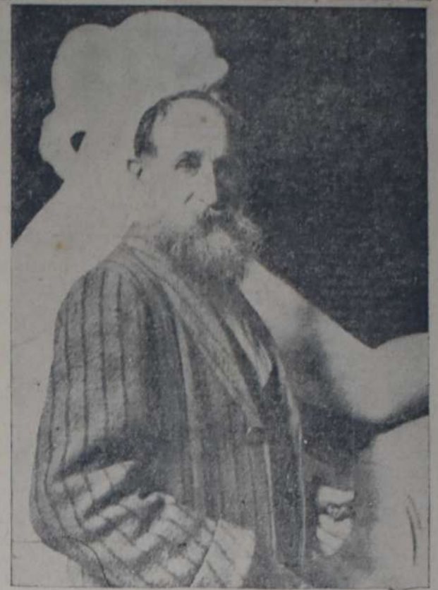
RETRATO DEL ESCULTOR ARISTIDES MAILLOL