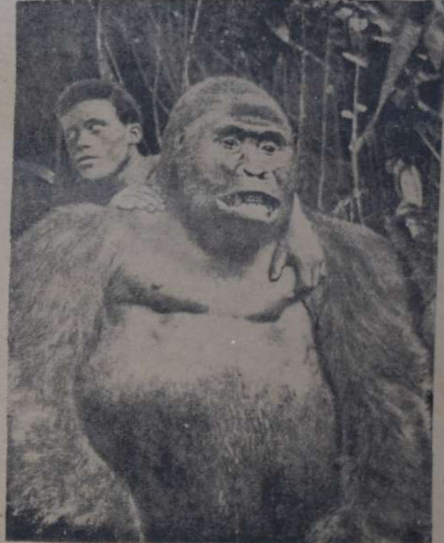
UN EJEMPLAR DE MONO FERROZ CAZADO POR HAGENBECK Y QUE FUE DOMESTICADO POR SU SISTEMA DE TRATAMIENTO BONDADOSO...

Doma de animales salvajes Por CARLOS HAGENBECK