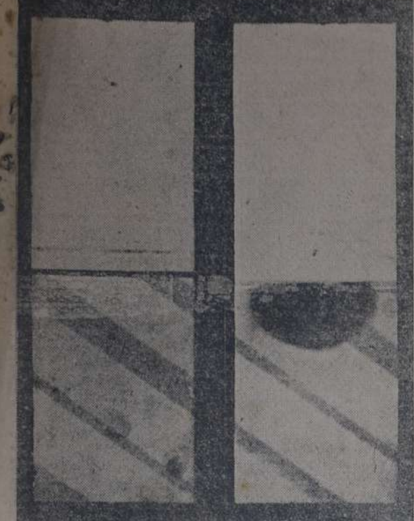
FOTOGRAFIA DE UNA CHAPA PINTADA EN LA PARTE INFERIOR, con albayalde y en la parte superior con pintura "Alba" sin veneno. A simple vista se observa que el albayalde no logra cubrir en forma perfecta las franjas negras ni la mancha producida por gases sulfurosos.

Reproducimos a continuación lo que en una obra conocida se escribe con respecto a los síntomas de esa enfermedad: